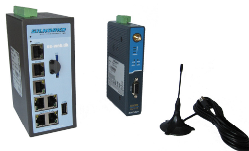
Webserver, GSM modul og antenne

Du har brug for en webserver – den leverer vi og installerer på selve vandværket. På webserveren ligger din styringsløsning, som vi har designet ud fra de krav vi sammen har været med til at opstille. Du skal efterfølgende sikre dig adgang til internettet via valgfri internetudbydere. Herefter er du online!