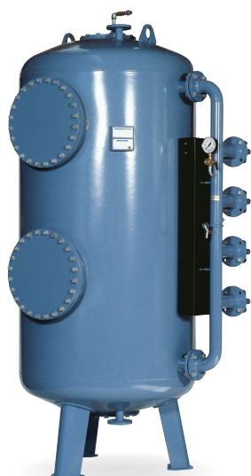
Trykfilteranlæg type TFB 14.