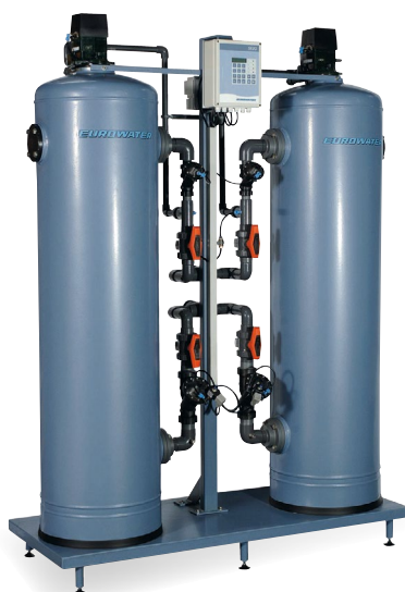
Blødgøringsanlæg type SMH 602.