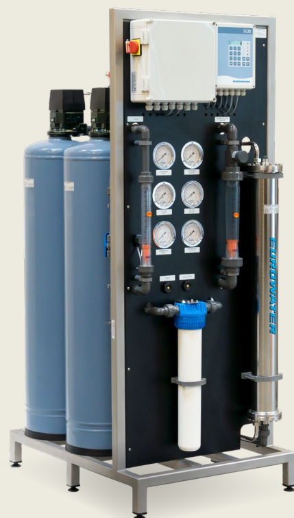
Rammemonteret CU:RO kompaktanlæg; et komplet omvendt osmoseanlæg bygget sammen med et forbehandlingsanlæg på en ramme af rustfrit stål – klar til brug.

De mange års erfaring, seriefremstilling og et modulopbygget standard-system garanterer driftssikre anlæg, kort leveringstid og konkurrencedygtige priser.