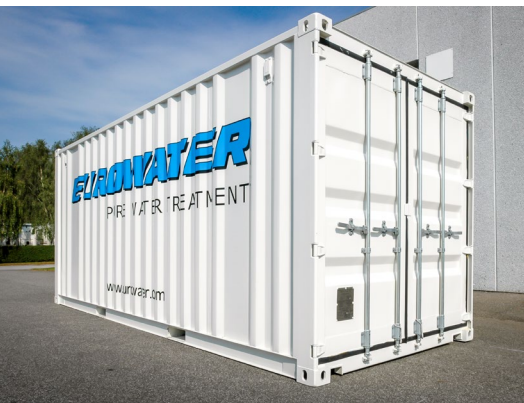
Komplet vandbehandlingsanlæg i container – klar til brug. Til leje eller salg.