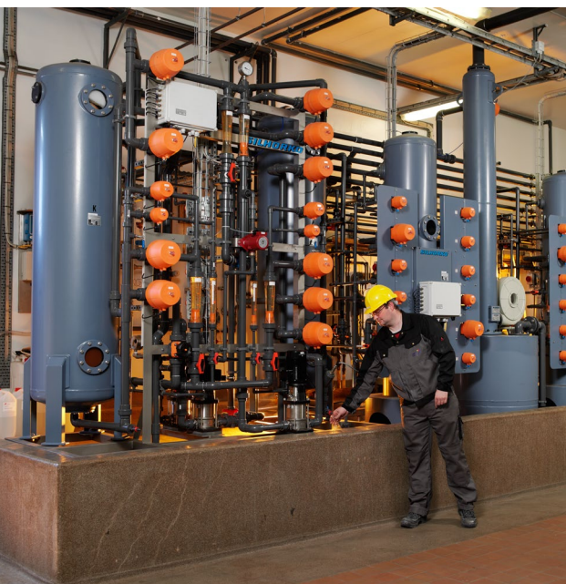
Kedelspædevand til højtryksdamp turbine på kraftvarmeværk.